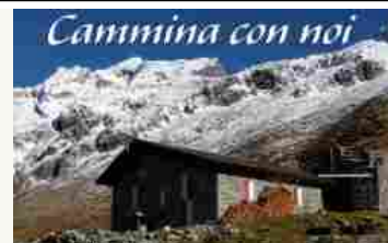
Salendo al Bivacco Primalpia, alla scoperta della Val dei Ratti